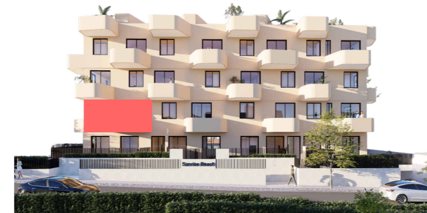
PLANTA PRIMERA. SITUACION VIVIENDA EN ALZADO